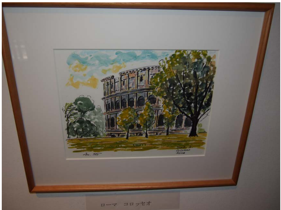
ローマ コロッセオ