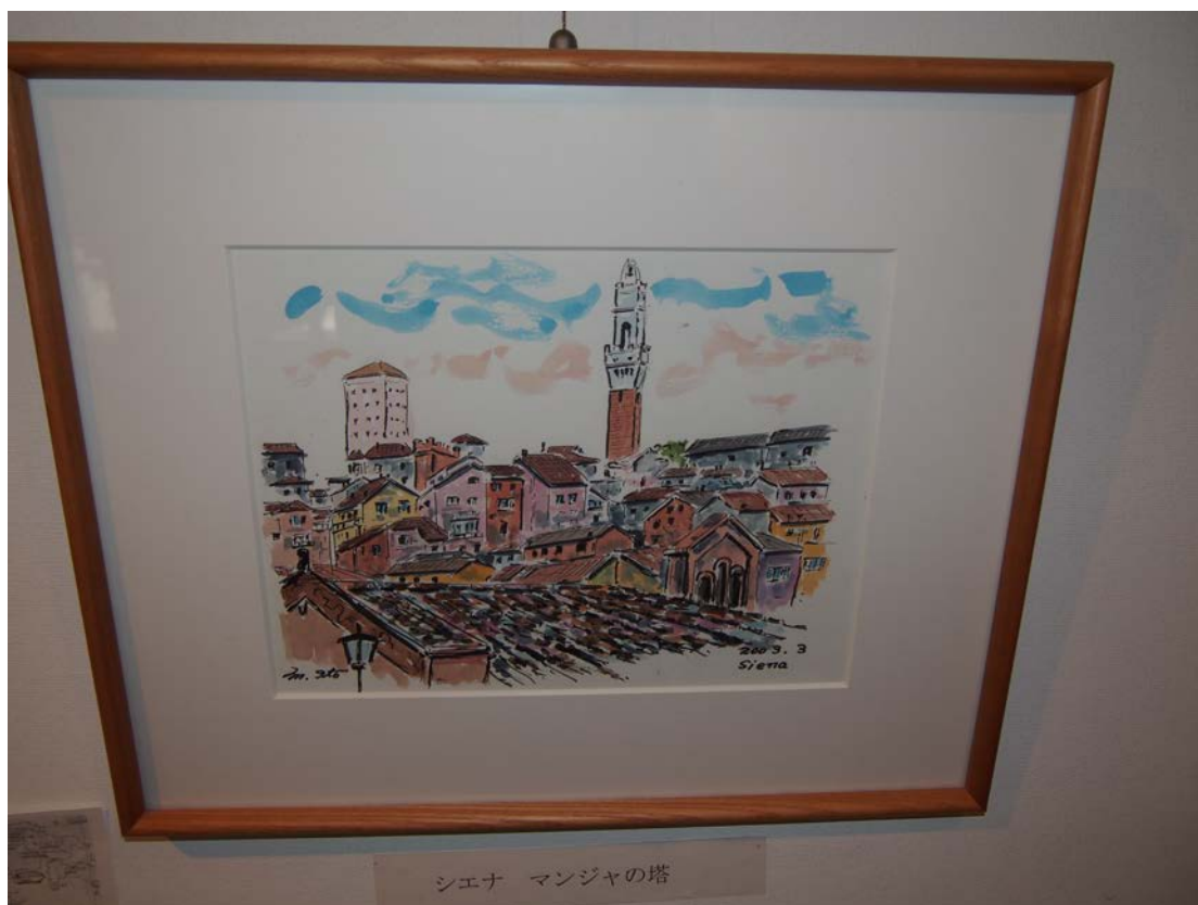
シエナ マンジャの塔