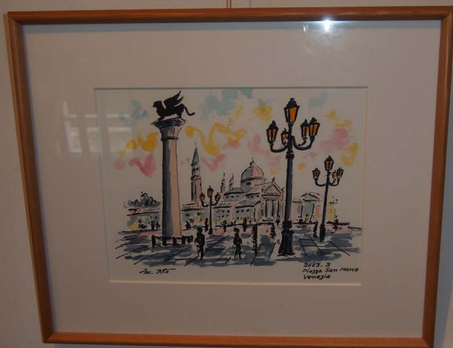
ヴェネツィア サン・マル コ広場