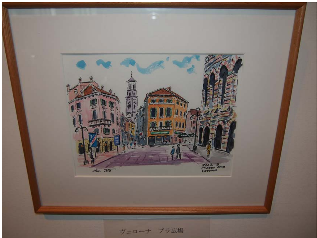
ヴェローナ ブラ広場