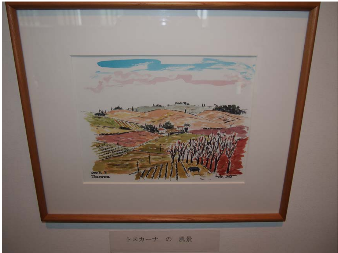
トスカーナ の 風景