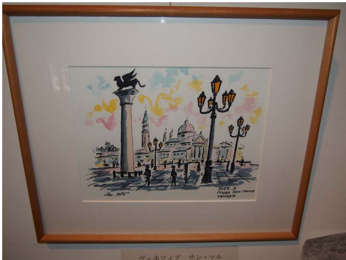
ヴェネツィア サン・マル