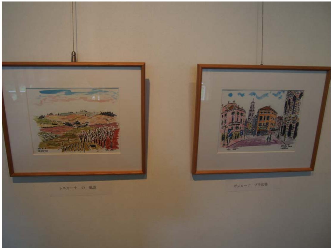
トスカーナの風景