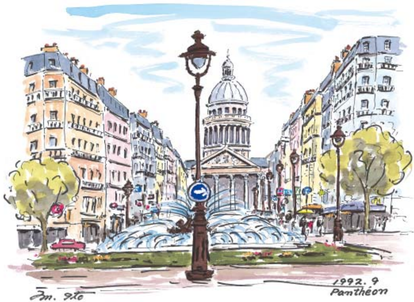
パリー、パンテオン (1992.9)