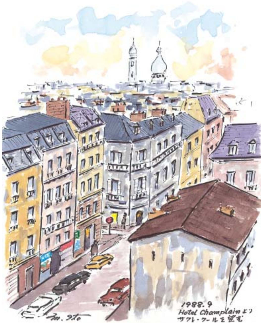
パリー、Hotel Champlainよりサクレ・クールを望む (1988.9)