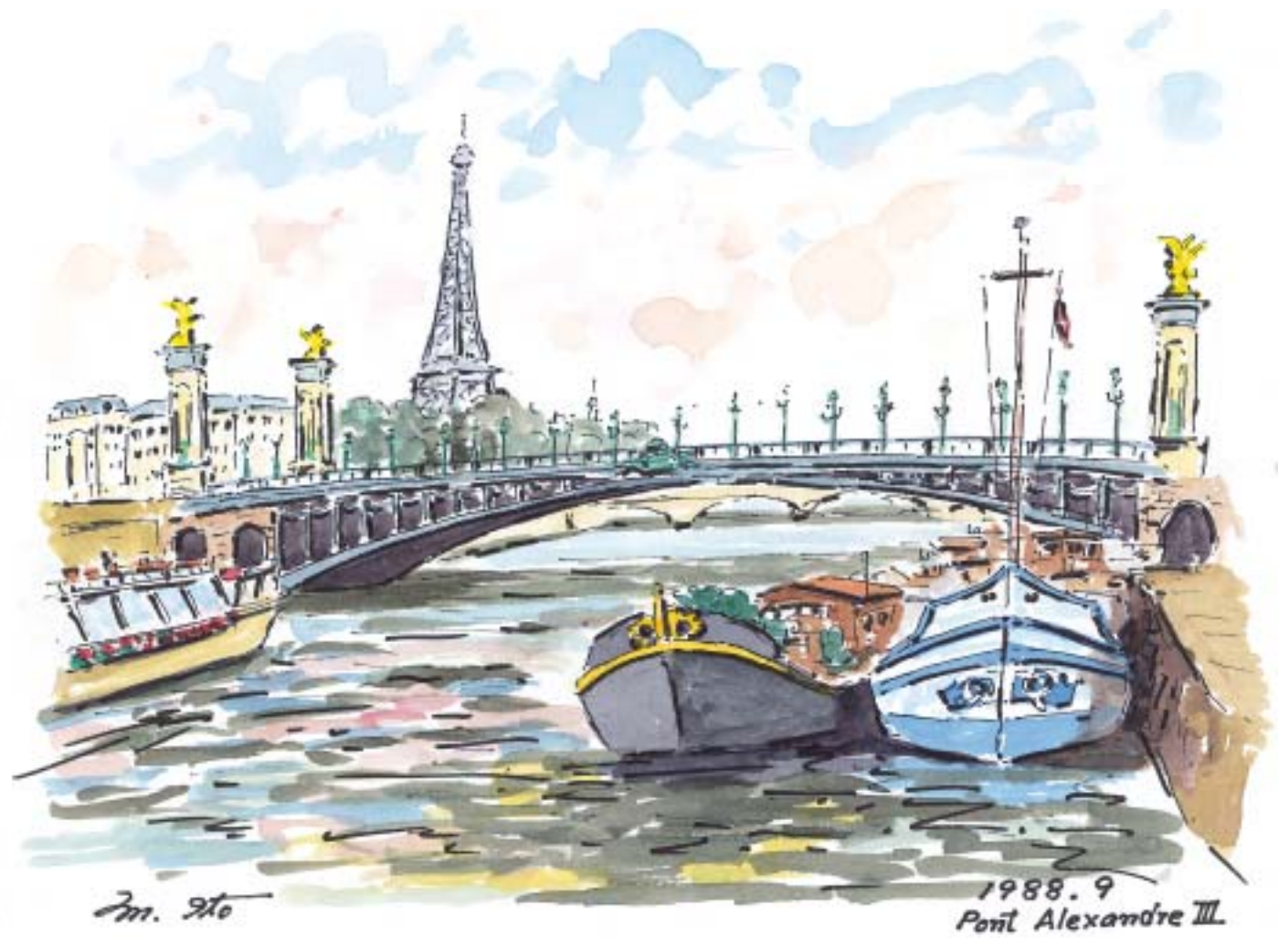
パリー、エッフェル塔、アレキサンダー三世橋、セーヌ川 (1988.9) サインペン、水彩、F3