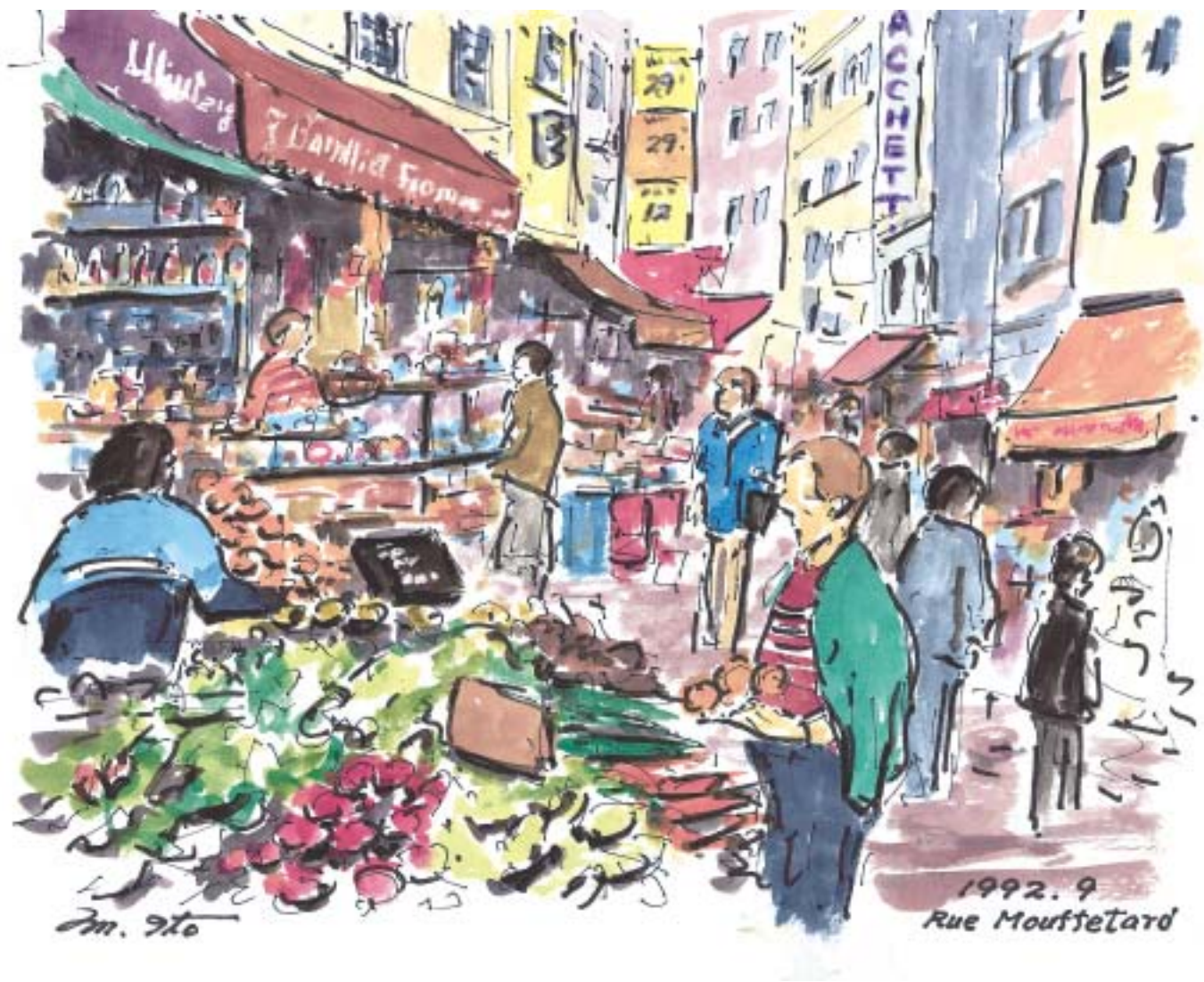
パリー、ムフタール通り (1992.9)