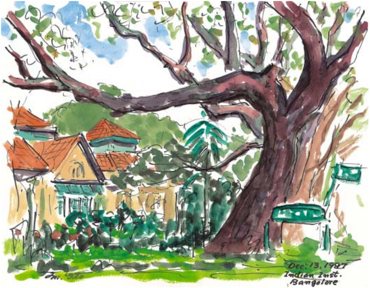
インド、バンガローのインド科学研究所 (1997.12)