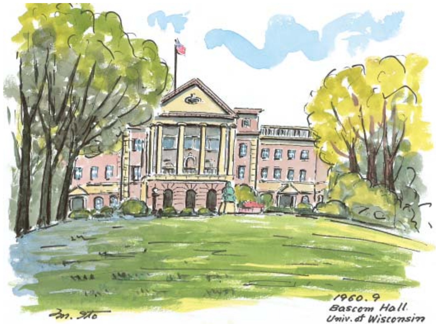
ウイスコンシン大学、Bascom Hall (1960.9)