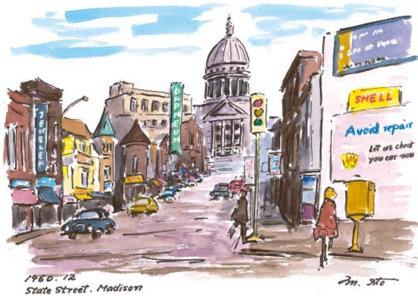
マジソン、State Street (1960.12)