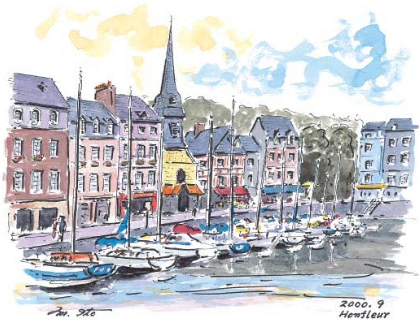
オンフルールの港 (2000.9)