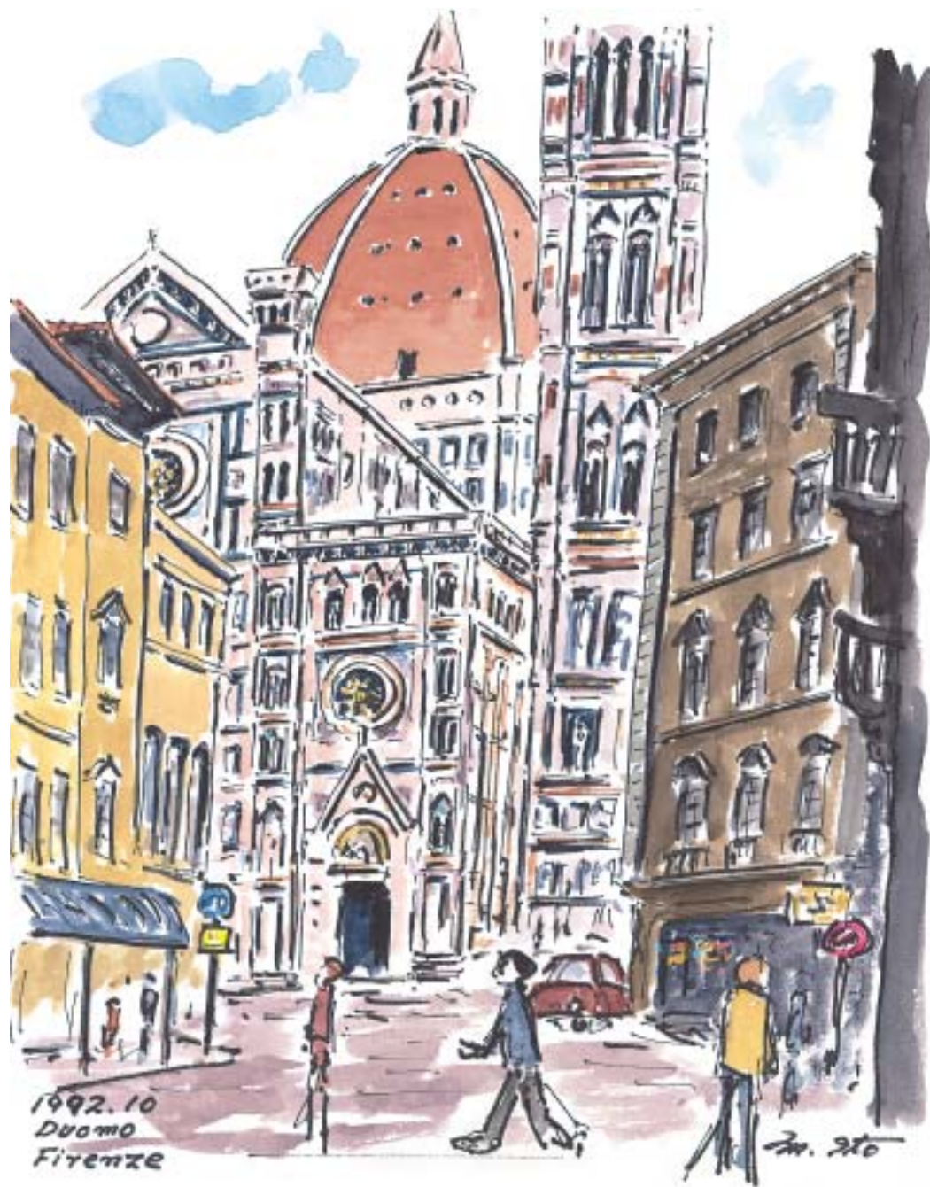
フィレンツェ、花の聖母堂 (1992.10)