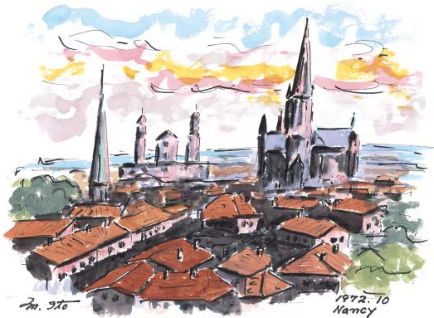
ナンシーの夕暮れ (1972.10)