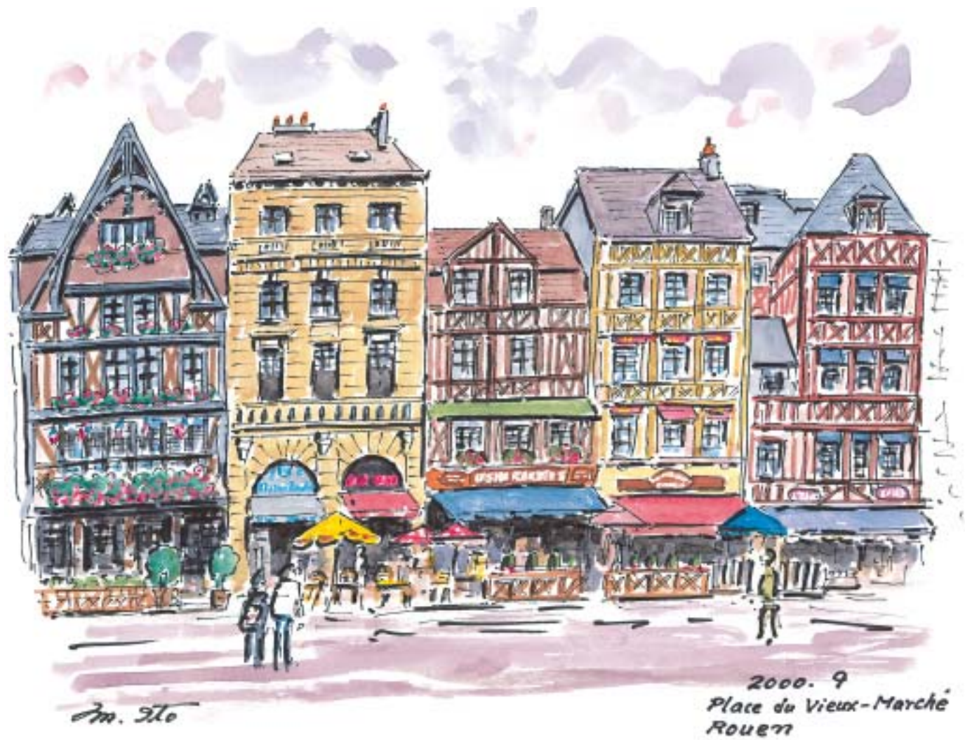
ルーアン、旧市場広場 (2000.9)