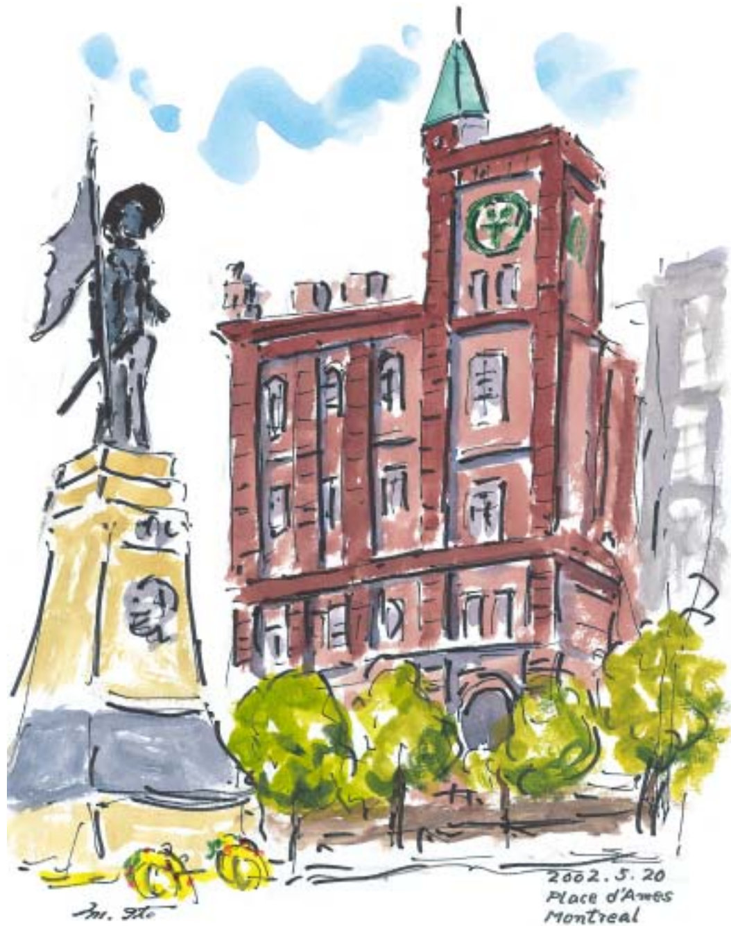
モントリオール旧市街のプラス・ダルム (2002.5)