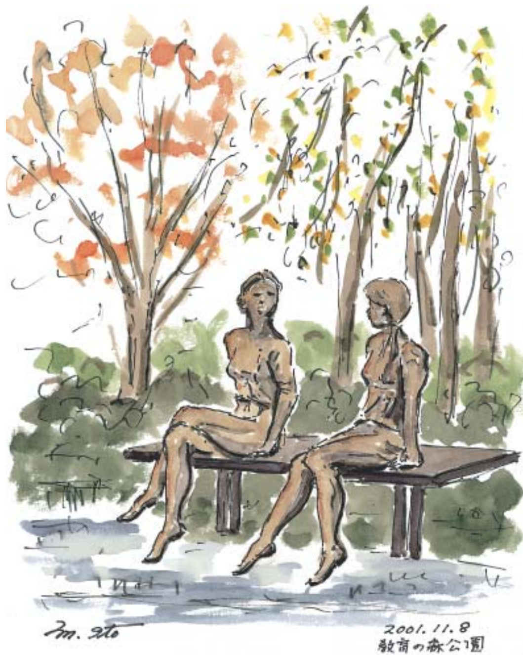
教育の森公園の女性像 (2001.11)