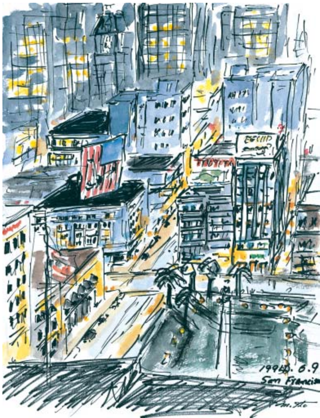
サンフランシスコ、Union Squareの夜景 (1994.6)