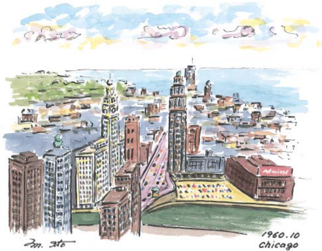
シカゴ中心部、シカゴリバー、ミシガン湖 (1960.10)