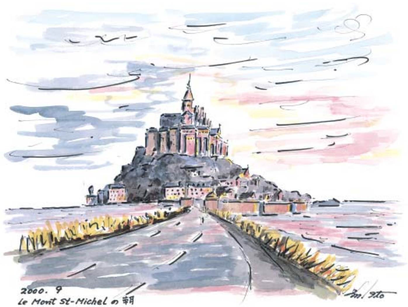
モン・サン・ミッシェルの朝 (2000.9)