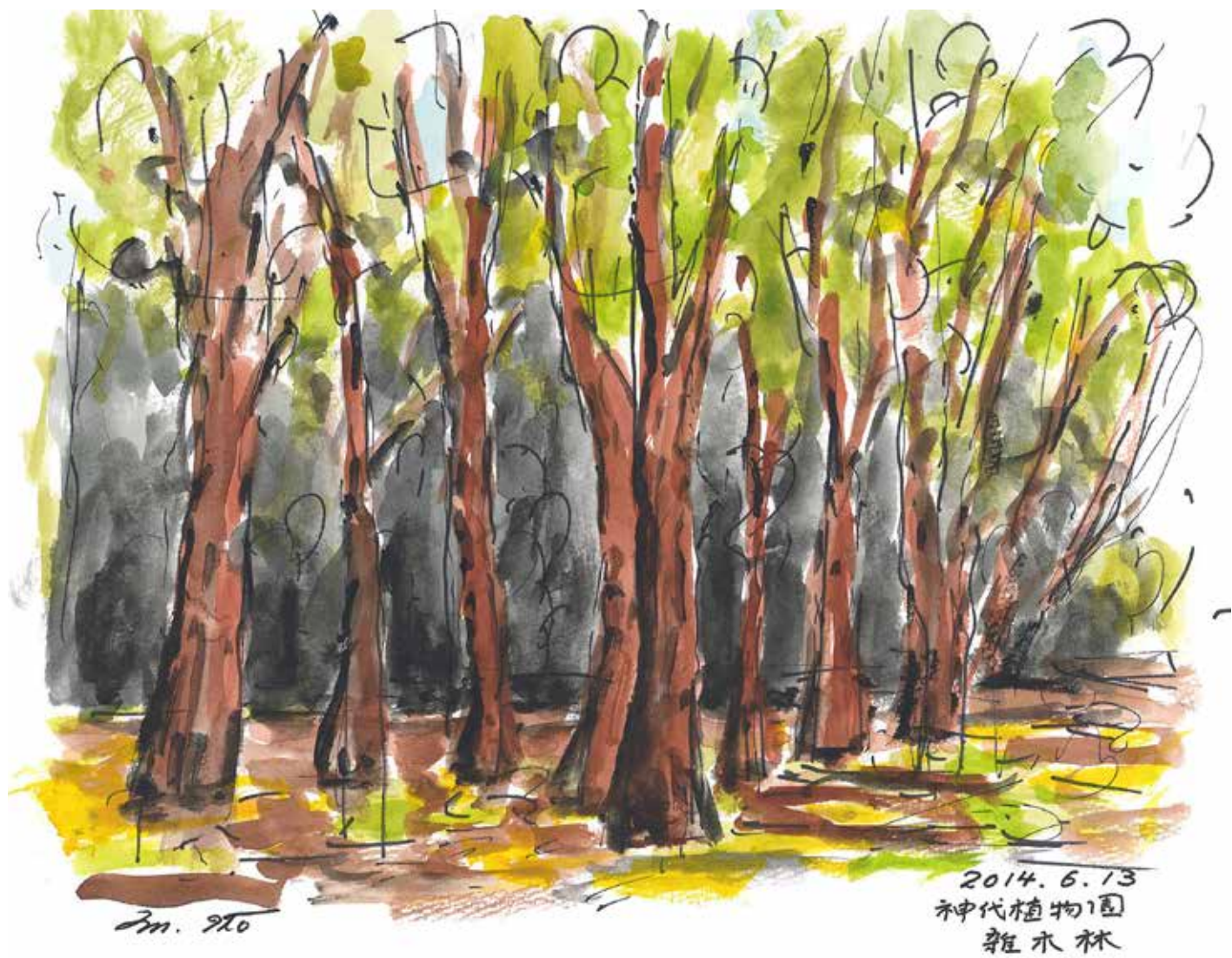
2014.6 神代植物園、雑木林