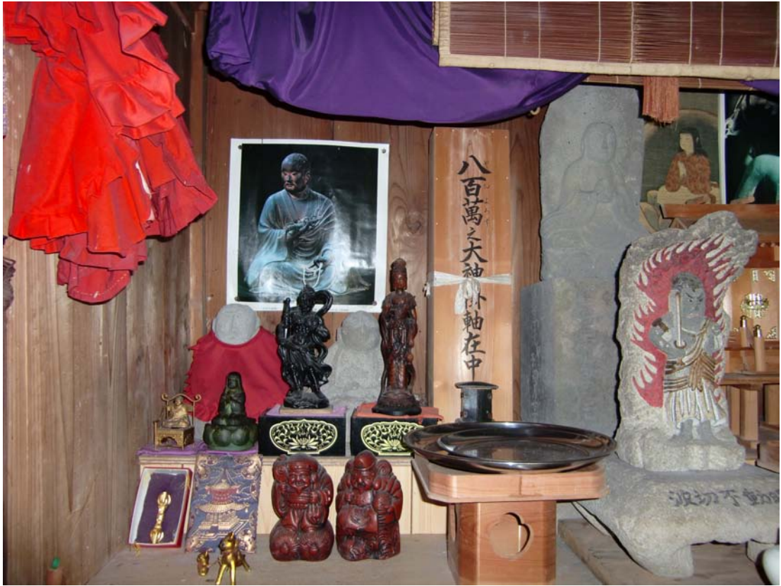
立江の地藏尊の前は波切不動明王