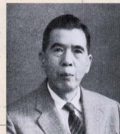
菅原 健 ※ 地球水環境学の創始 学士院賞など