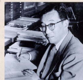
坂田 昌一 ※ 坂田モデル及びニュートリノ 質量行列の提唱 恩賜賞、学士院賞など