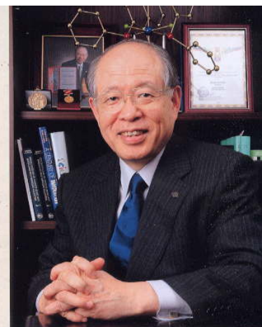
野依 良治 不斉分子触媒の開発 ノーベル賞、文化勲章、学士院賞など