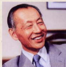
早川 幸男 ※ スペース天文学の創設 学士院賞、名大学長など